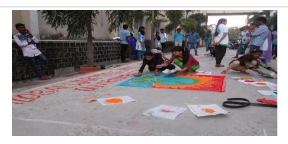
Volunteers participating in Rangoli Competition