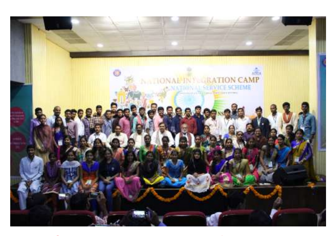
Group photo with all the participants of all the states