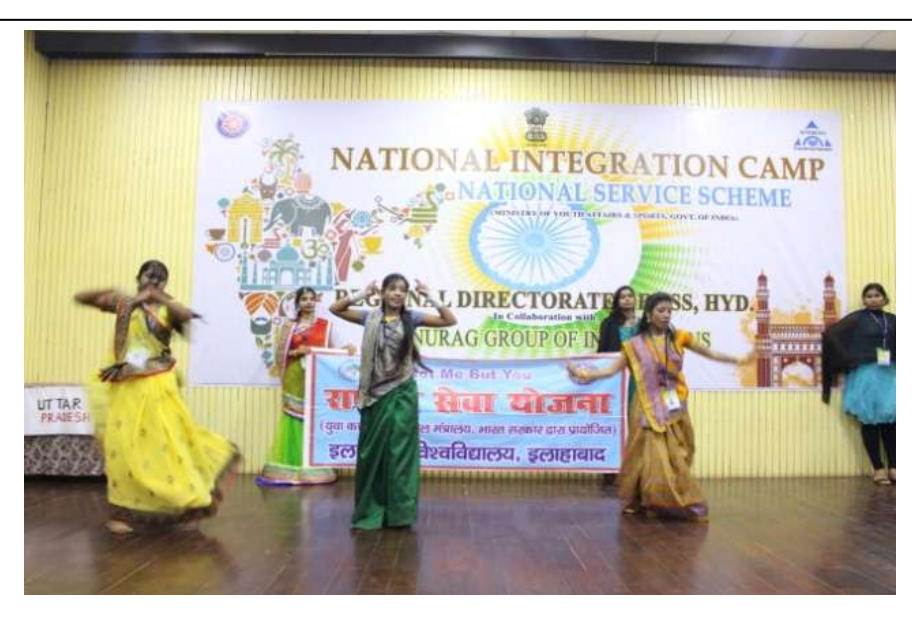
Cultural performance by UP contingent