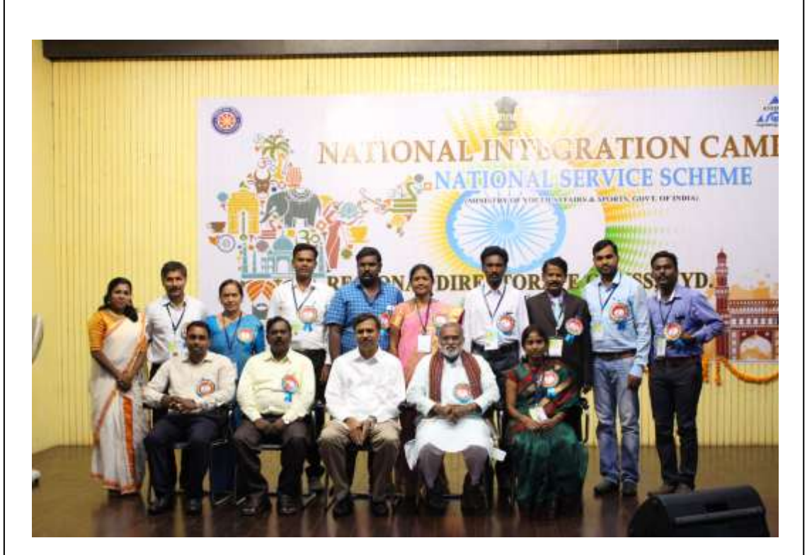
Group photo with all the program officers of all the states