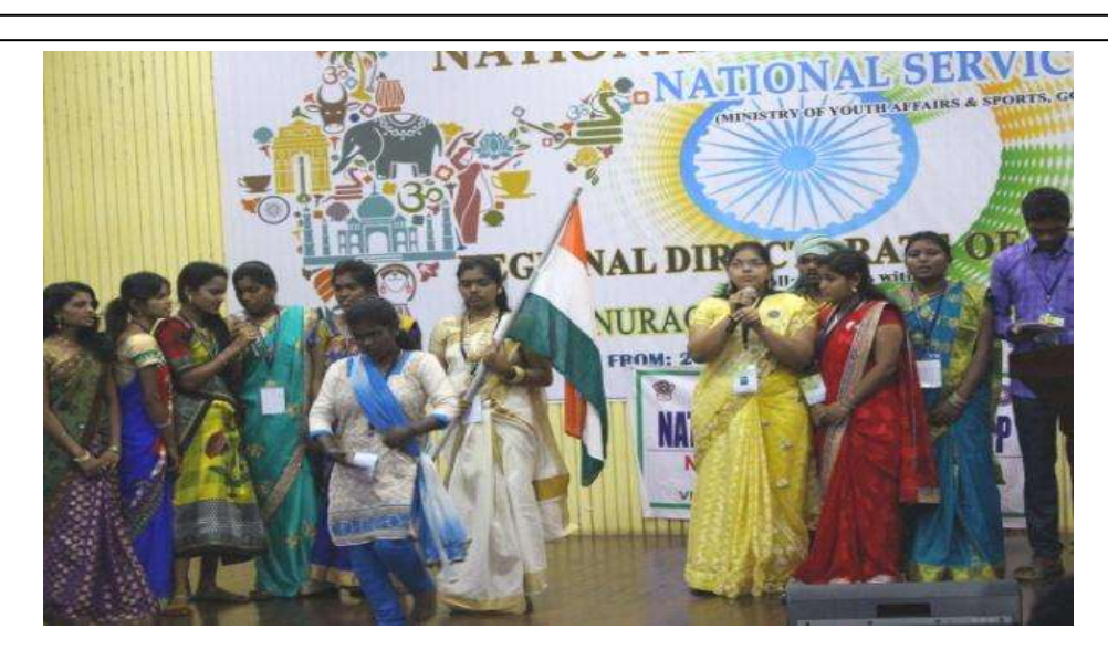
Cultural performance by Andhra Pradesh Contingent