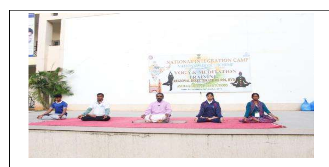
Morning Pranayamam yoga