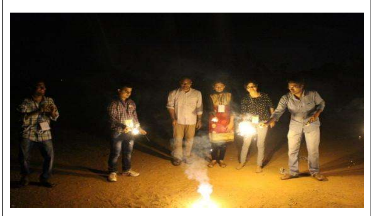
Volunteers celebrating Deepavali using soundless crackers