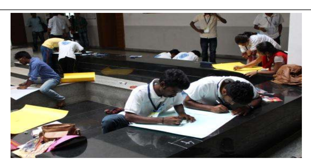
Poster presentation competition on Beti Bachao Beti Padhao and Swachh Bharat