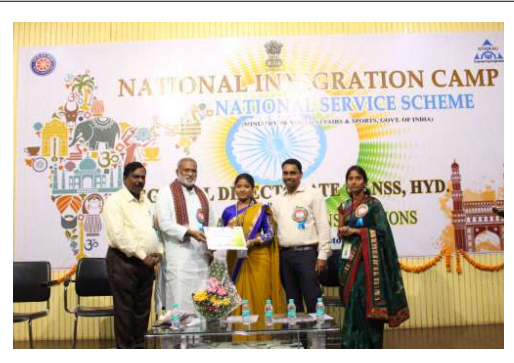
Participation Certificate distribution in Valedictory function