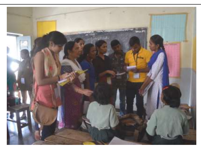
Participants interacting with school Children